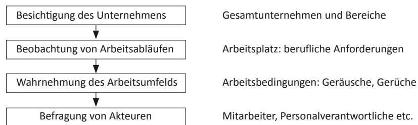
Abbildung 3: Betriebserkundungen

Bei einer Betriebserkundung entwickeln die Kursteilnehmenden im Unterricht themenbezogene Fragen, die sie im Erkundungsbetrieb mit Hilfe unmittelbarer Wahrnehmungen, Beobachtungen sowie Befragungen von Mitarbeiter_innen untersuchen. Die gewonnenen Informationen und Erfahrungen werden gesammelt, dokumentiert und nach der Erkundung besprochen. Betriebserkundungen ermöglichen so ein mit allen Sinnen entdeckendes „Lernen vor Ort“, das mit Hilfe verschiedener Methoden und Techniken direkte Einblicke in betriebliche Zusammenhänge erlaubt: